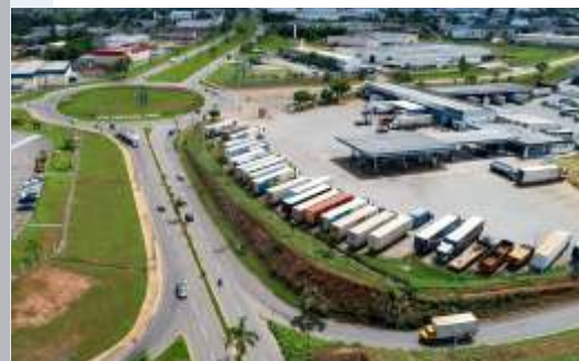
AO LADO DO PÓLO INDUSTRIAL E PARQUE DE EXPOSIÇÕES

Com infraestrutura pronta para construir, o Portal das Águas conta com rede de água, energia elétrica, vias asphaltadas, linha de ônibus integrada e está localizado ao lado do lago da cidade e a apenas 30 minutos do Shopping Flamboyant.