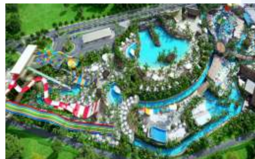
PRÓXIMO AO MAIOR PARQUE AQUÁTICO DO BRASIL