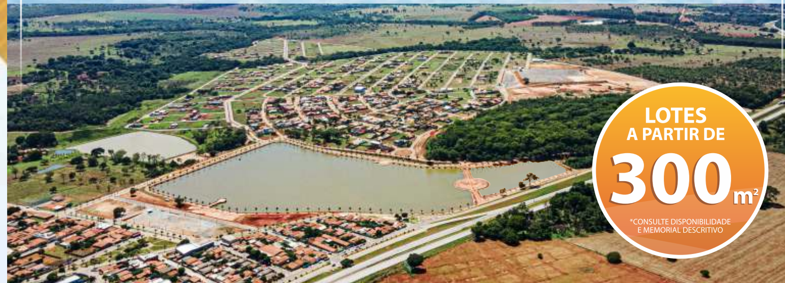
FOTO DO LOCAL COM VISTA AÉREA DO LAGO E DO PORTAL DAS ÁGUAS