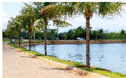
LAGO COM PISTA DE CAMINHADA PAISAGISMO E URBANIZAÇÃO