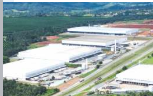
PÓLO DE EMPRESAS GIGANTES DE LOGÍSTICA EM HIDROLÂNDIA

Hidrolândia se tornou uma referência em qualidade de vida e vem imprimindo um ritmo constante de progresso com destaque para o pólo logístico na região metropolitana da grande Goiânia. A cidade projeta dobrar o número de postos de trabalho nos próximos anos, favorecida pela localização estratégica ao lado de Aparecida de Goiânia e da capital.