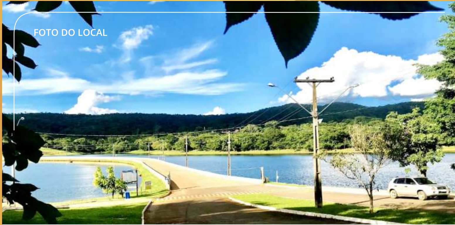
FOTO DO LOCAL