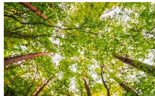
ÁREA VERDE PRESERVADA COM MAIS DE 190.000 m²