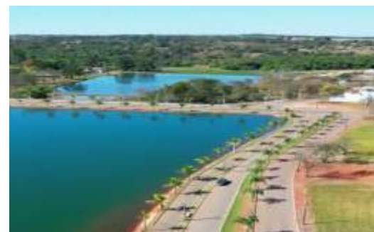
PISTAS DE ACESSO DUPLICADAS COM PAISAGISMO